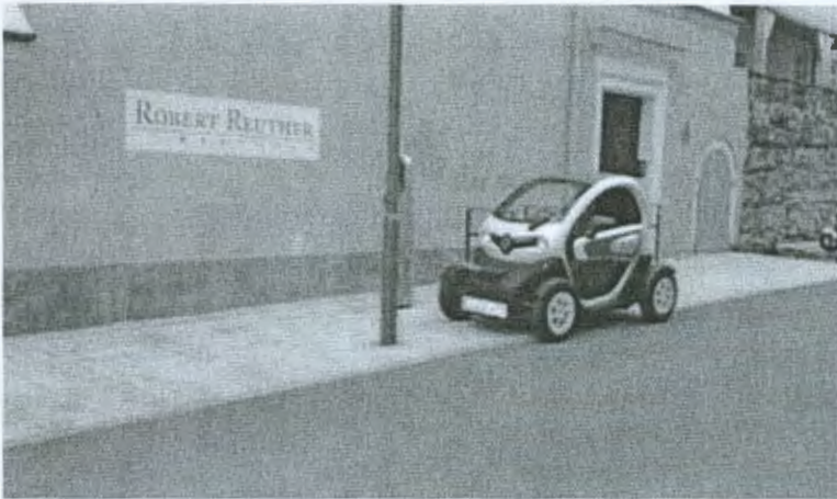
Ladestation mit möglicher zusätzlicher Parkmöglichkeit

Damit der freigewordene Raum auch nur für Fahrzeuge genutzt wird, die dort Strom tanken wollen, und nicht durch Fahrzeuge mit Verbrennungsmotoren als zusätzliche Parkmöglichkeit verstellt wird, bitten wir um eine ausreichende Beschilderung.